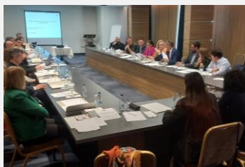
Ceremonia de certificación de instructores de SCREAM y Youth@Work.