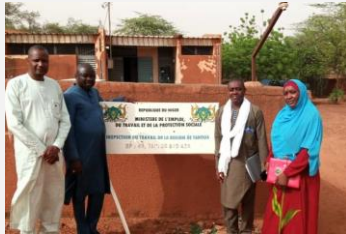
Misión conjunta del Ministerio de Empleo, Trabajo y Protección Social y la OIT a la oficina regional de inspectores laborales de Tahoua.