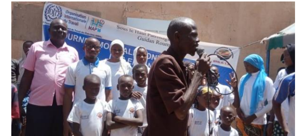
Evento de generación de conciencia en el Día Mundial contra el Trabajo Infantil que se celebró en el campo de refugiados de Guidan Roumdji el 12 de junio de 2023.

Los recursos gubernamentales para continuar con las actividades de capacitación y generación de conciencia son limitados.