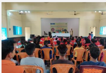
Programa de concientización con la comunidad local de Jamui (Bihar).