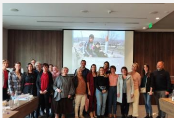
Participantes del curso de capacitación sobre trabajo infantil que se dictó el 19 de octubre de 2023 en Novi Sad (Serbia).