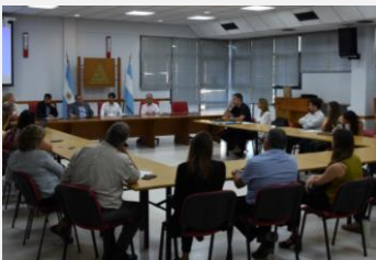
Taller con inspectores laborales en la provincia de La Pampa.