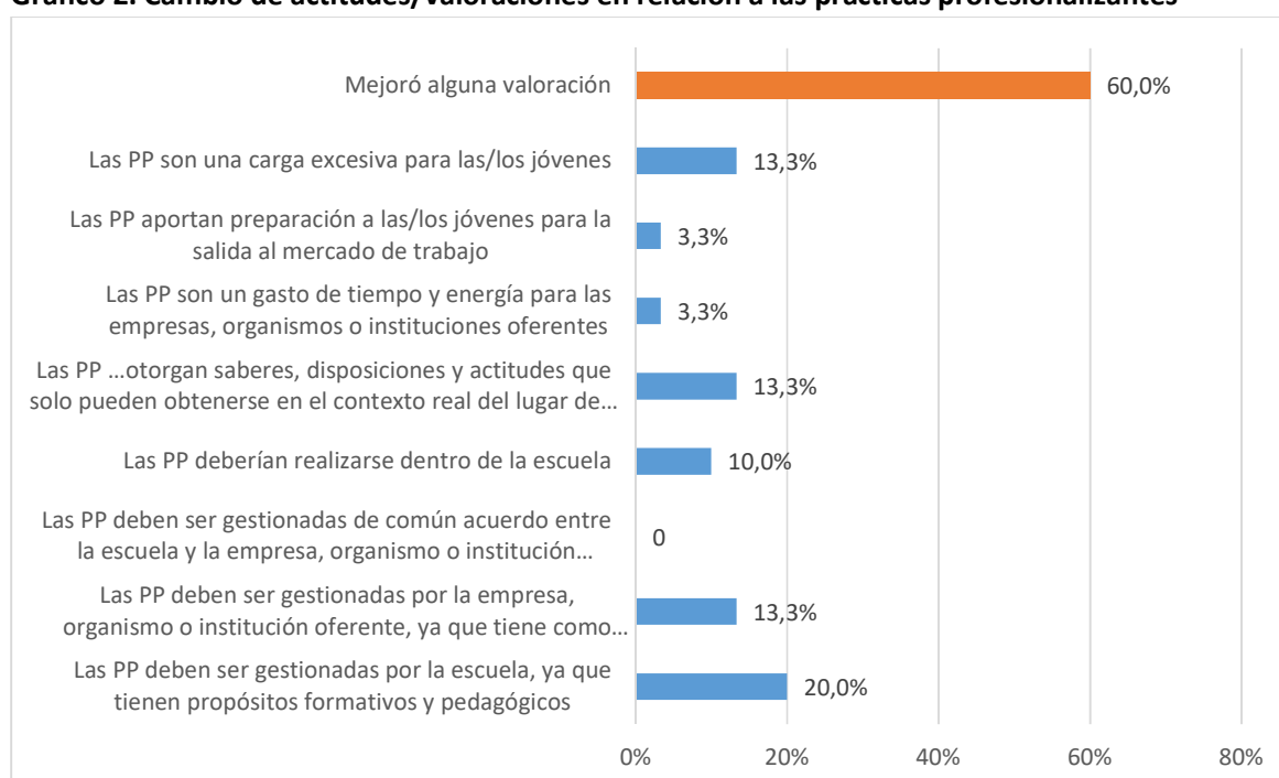
Gráfico 2. Cambio de actitudes/valoraciones en relación a las prácticas profesionalizantes