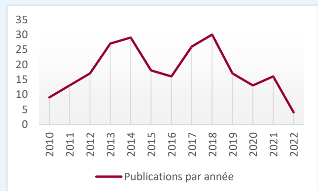
Figure 1 – Études incluses par année, 2010-2022

Source – Recherche effectuée par les auteurs.