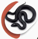
TILCUATE (Tipo de víbora negra)