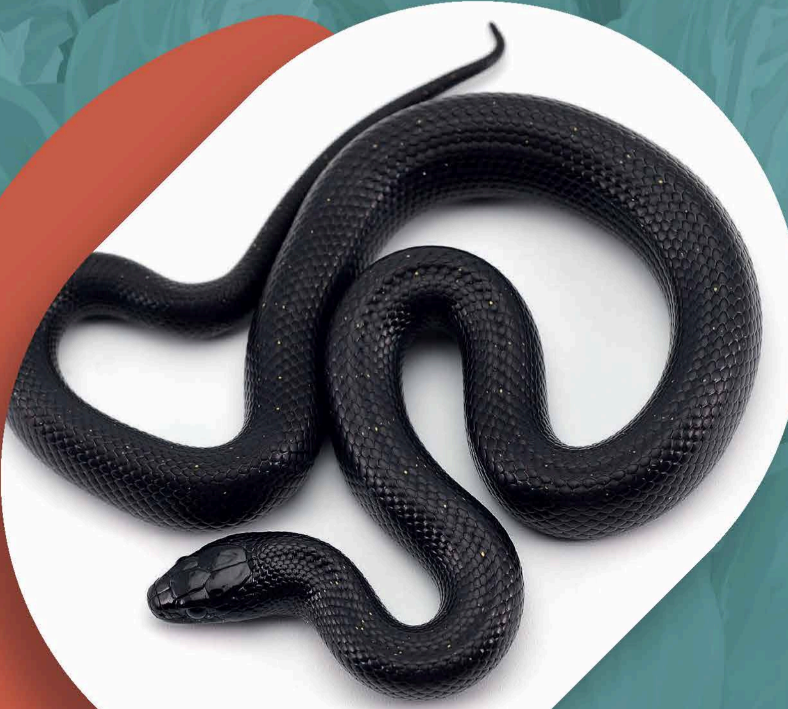
TILCUATE (Tipo de víbora negra)