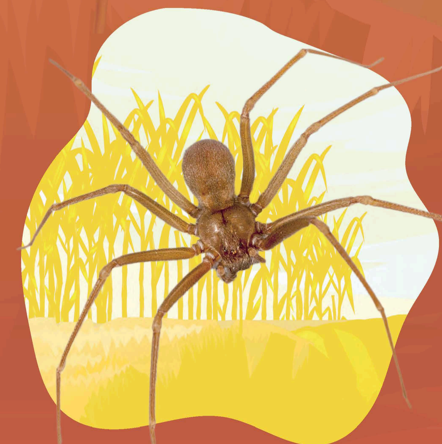
ARAÑA LOXOCELES RECLUSA