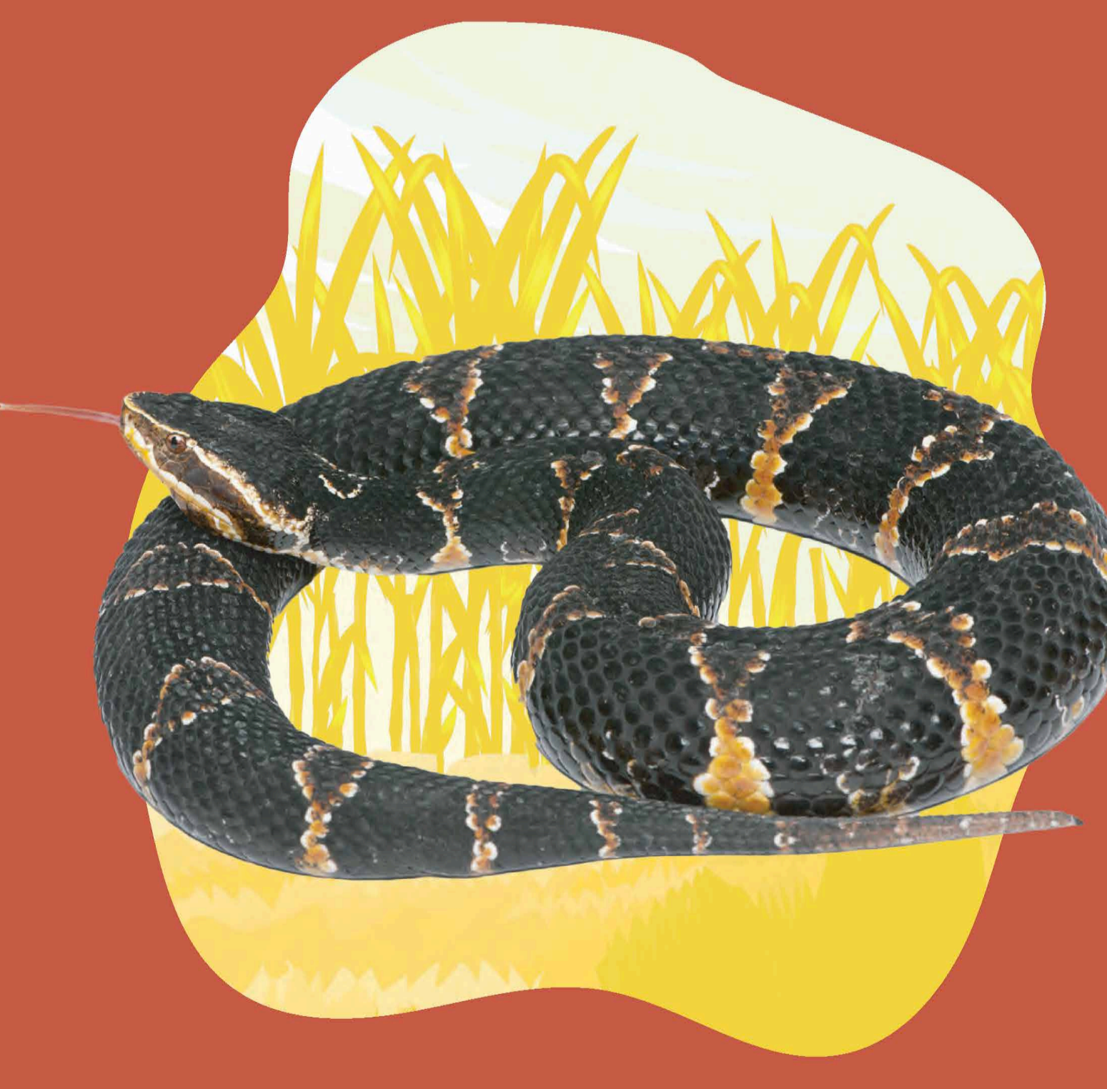
SERPIENTE AGKISTRODON BILLNEATUS