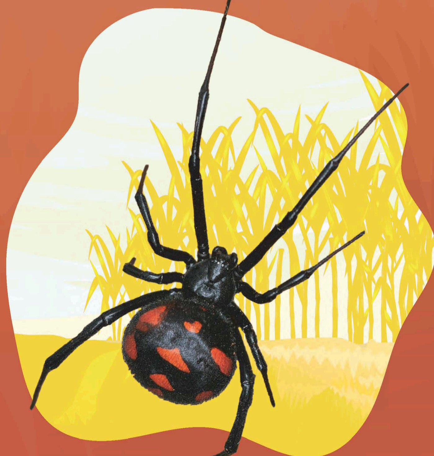
ARAÑA LATRODECTUS MACTANS