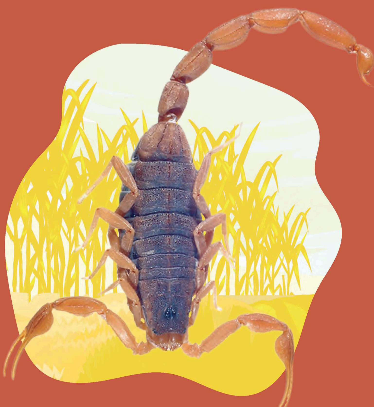
ALACRÁN C. NOXIUS