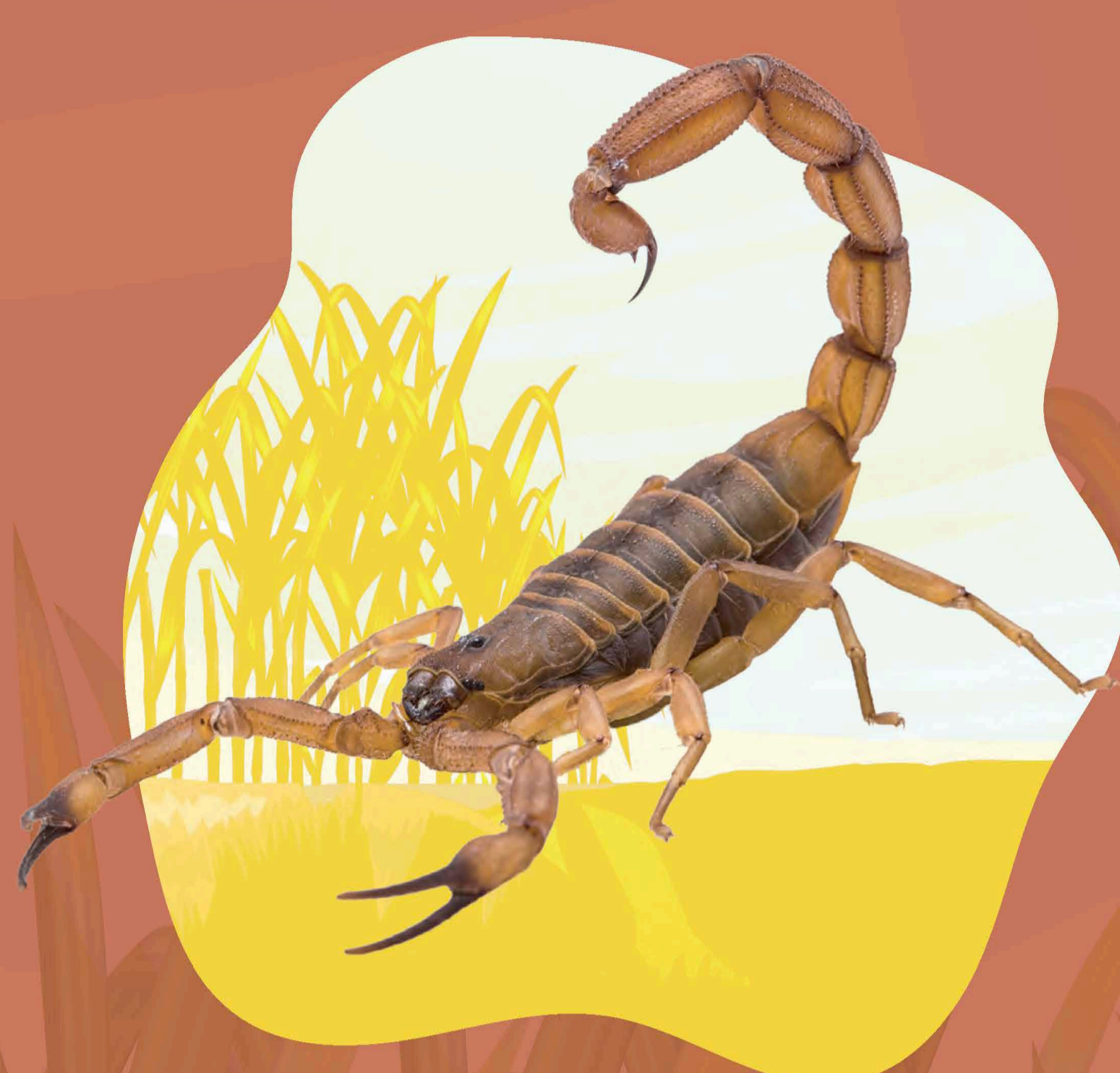
ALACRÁN CENTRUROIDES ELEGANS