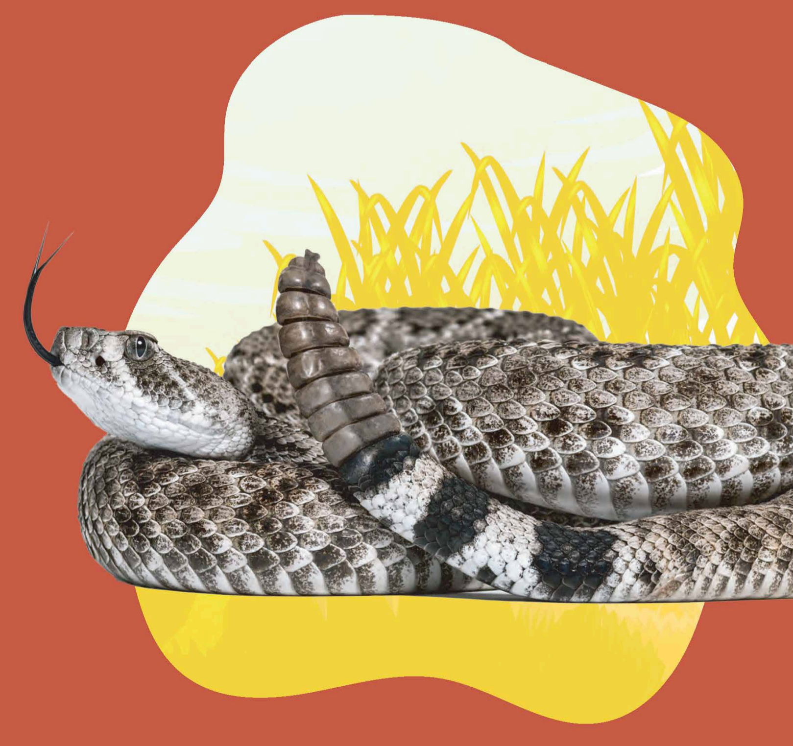
SERPIENTE CROTALUS BASILISCUS