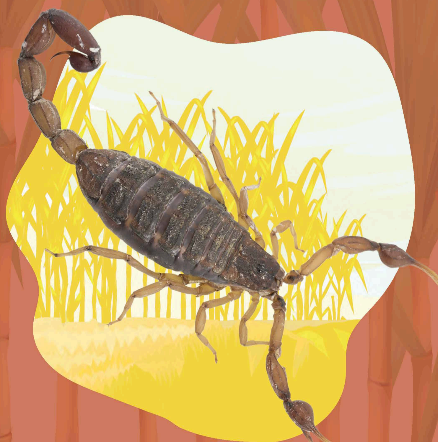
ALACRÁN C. INFAMATUS