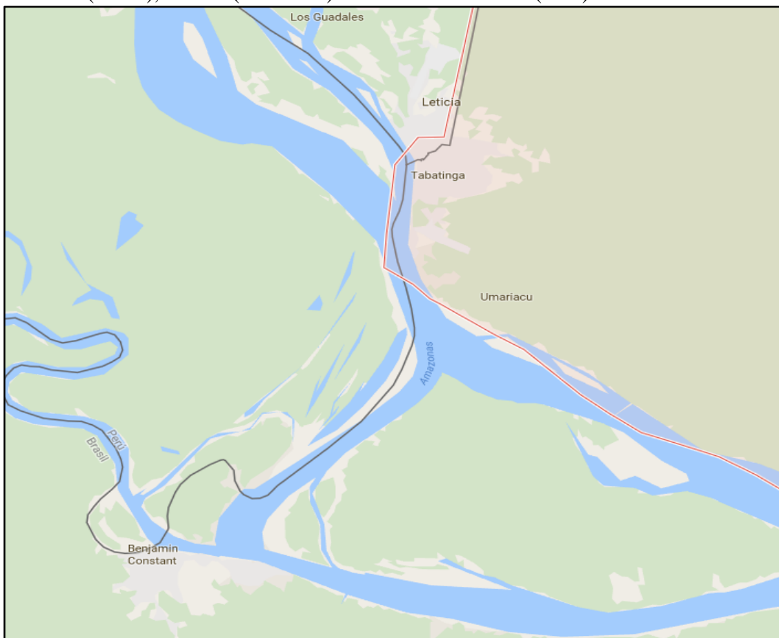
Mapa 2. Ubicación de las zonas de recojo de datos potenciales Tabatinga y Benjamin Constant (Brasil), Leticia (Colombia) Santa Rosa e Islandia (Perú).

de transporte (fluvial o terrestre) en frontera con poca capacidad de control, iv) indicios de trabajo forzoso y trata identificados por las exploraciones previas del equipo de campo. Esto permite concentrar el recojo de datos en cinco puntos en los tres países: Tabatinga y Benjamin Constant (Brasil), Leticia (Colombia) Santa Rosa e Islandia (Perú). La ubicación de las rutas de transporte y la situación específica aparece en los mapas oficiales y de ubicación regional, de manera que los mapas insertados en este informe son referenciales.