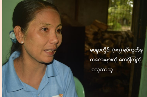
မန္တလေးမြို့၊ (၈၇) ရပ်ကွက်မှ ကလေးများကို စောင့်ကြည့်လေ့လာသူ

World Vision မှ ကလေးသူငယ်များအား စောင့်ကြည့်လေ့လာသူ