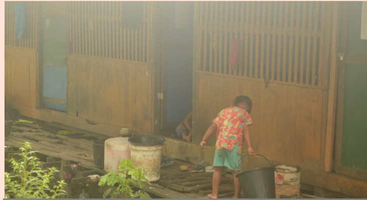
(၈၇) ရပ်ကွက်တွင်းကွင်းဆင်းစဉ် ရေပုံးဆွဲနေသော ကလေးငယ်အား တွေ့ရစဉ်၊ ဖခင်အလုပ်သွားသောအခါ မိခင်၏ အိမ်မှ ကိုယ်တိုင် စောစောလျင်လျင် ကူညီနေသည်ကို အချို့ အိမ်ထောင်စုများတွင် တွေ့ရသည်။

ကျော်ဝင်းနေထိုင်တဲ့ ရပ်ကွက်(၈၇)က ကလေးတွေဟာ အလွန်ပင် ငယ်ရွယ်ကြပြီး အလုပ်လုပ်ဖို့အစားကျောင်းတက်သင့်တယ်။ သူ့အတွက် ကတော့ မိဘတွေက ကလေးတွေကျောင်းတက်ဖို့ အားပေးရန်အဓိက တာဝန်ရှိတယ်။ "ကလေးတွေပညာတတ်ဖြစ်ရင်၊ အနာဂတ်မှာ လုပ်မယ်လို့" ခံယူချက်နဲ့ အတူဖြည့်စွက်ပြောကြားခဲ့သည်။ ဒါဟာ သူ့ရဲ့ ပြင်းပြသော ရည်မှန်းချက်ထုတ်ဖော်ခြင်းရဲ့ နည်းလမ်းတစ်ခုဖြစ်ခဲ့တယ်။