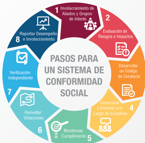
Cadena de Cumplimiento del Departamento de Trabajo de los Estados Unidos de América