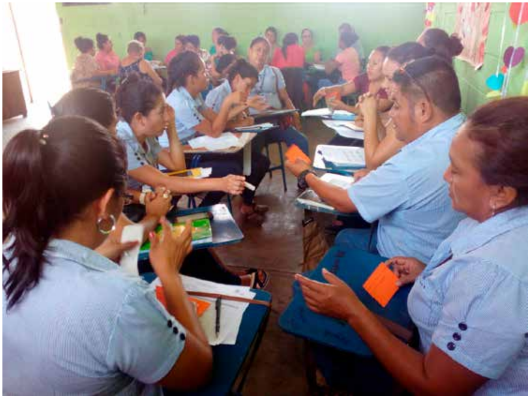
Actividad de formación de autoridades educativas en PROCAPS.

El Programa Integral ACCIONE es de aplicación permanente.