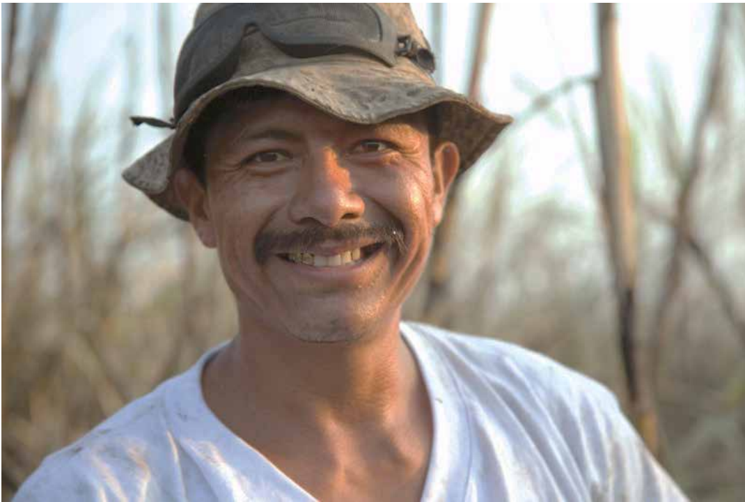
Colaborador de la agroindustria azucarera guatemalteca.