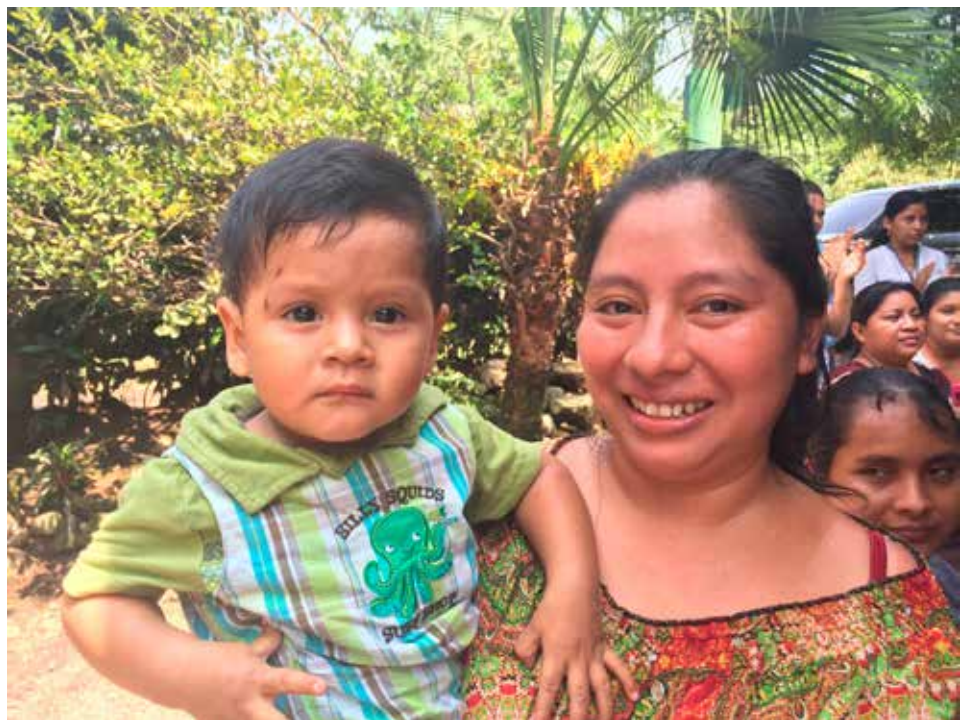
Beneficiaria del Programa Mejores Familias