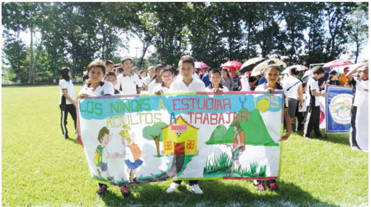
Actividad de sensibilización con niños en áreas de influencia cañera