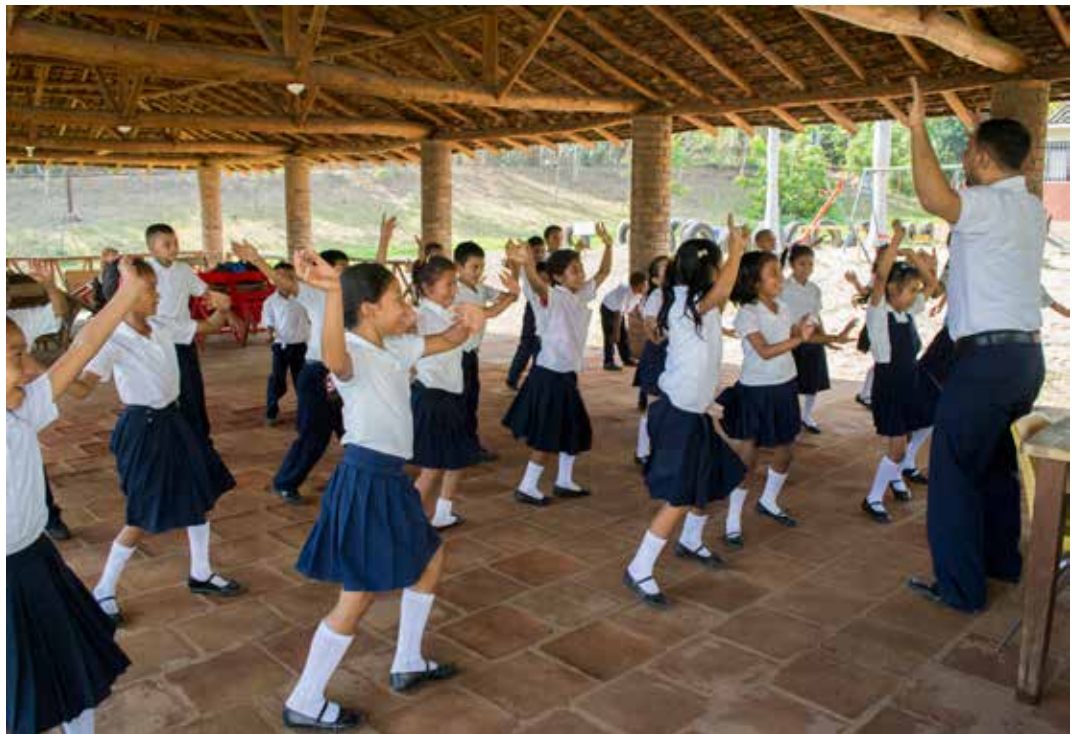
Actividades recreativas con niños en las áreas de influencia de la agroindustria.