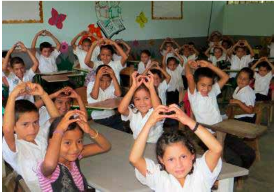
Niños en el Programa Escuelas de Corazón