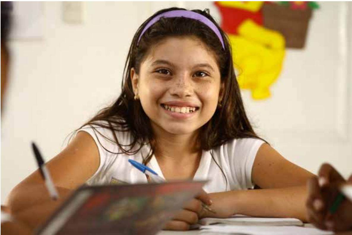
Niña participando en los programas educativos de la agroindustria azucarera