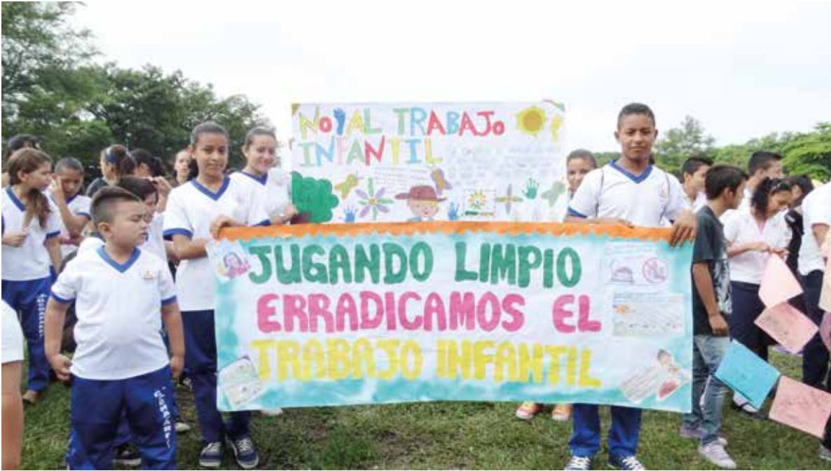
Actividades en zonas de influencia de la agroindustria azucarera para promover el respeto de los derechos de los niños.