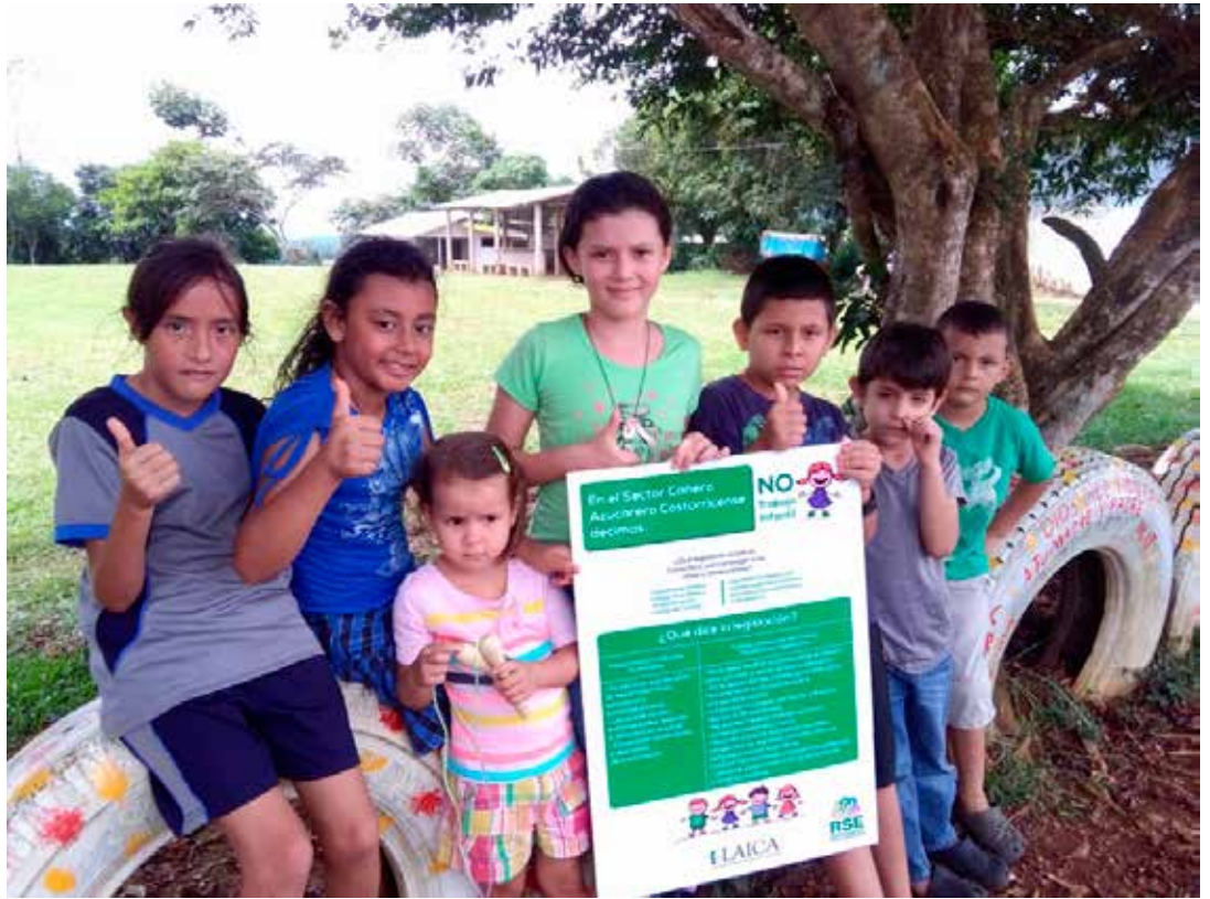
Niños participando en el Programa “Cultivando Futuro”